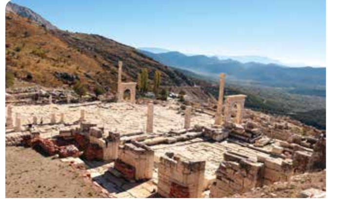
MS 1. yüzyıldan itibaren bu meydan giderek onursal anıtlarla dolmaya başladı. İmparatorlar, valiler ve yerel seçkinler için yapılmış heykel kaideleri, yazıtlar ve küçük anıtlarla agora adeta bir galeriye dönüşür. MS 500 civarında meydana gelen depremde bunların çoğu devrildi.

belirlenir ve agora politik kimliğinden çıkıp bir pazar yerine dönüşür.