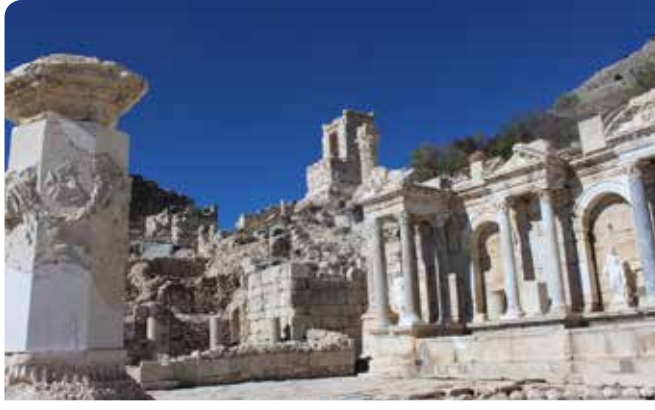
Yedi farklı taştan yapılmış Antoninler Çeşmesi'nin suyu 2010 Ağustos'undan beri tekrar çağlayarak akmaktadır. Bu anıtta su, mimari bezemenin bir parçası olarak kullanılmıştır. Haznede toplanan su, çeşmenin görkemli cephesini ve heykellerini yansıtır.