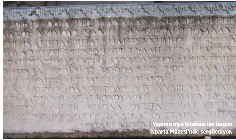
Yapının inşa kitabesi ise bugün Isparta Müzesi'nde sergileniyor.

kabul" anlamlarında, Panagias ise "bakire, lekesiz" anlamlarında Meryem'i ifade ediyor. Kilisenin iç mekanında bulunan süsleme öğelerinin de bu görüşü destekler nitelikte olduğu görülüyor. Kitabede yer alan bu bilgilerden yapının Meryem Ana'ya adandığı sonucuna varılrsa da, yapı günümüzde Isparta Kültür ve Turizm Müdürlüğüne "Aya İshotya (Yorgi) Kilisesi" olarak adlandırılıyor.