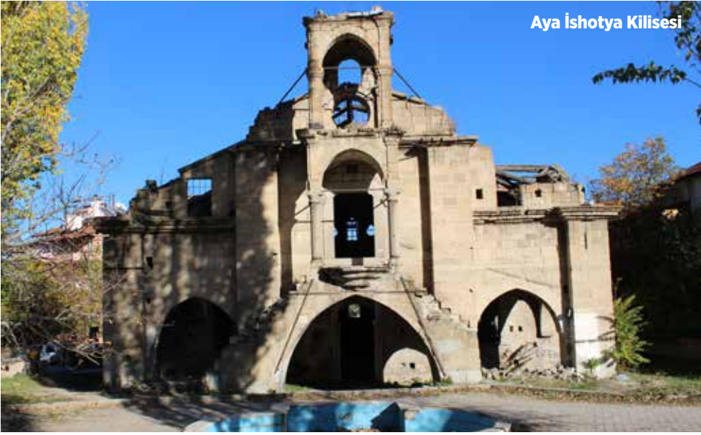
Aya İshotya Kilisesi