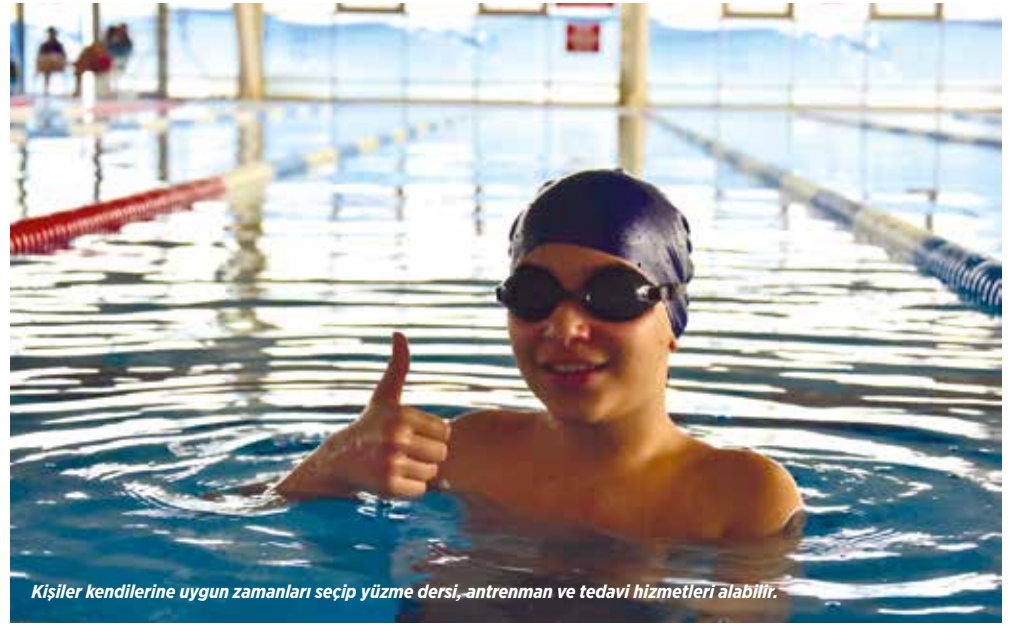
Kişiler kendilerine uygun zamanları seçip yüzme dersi, antrenman ve tedavi hizmetleri alabilir.