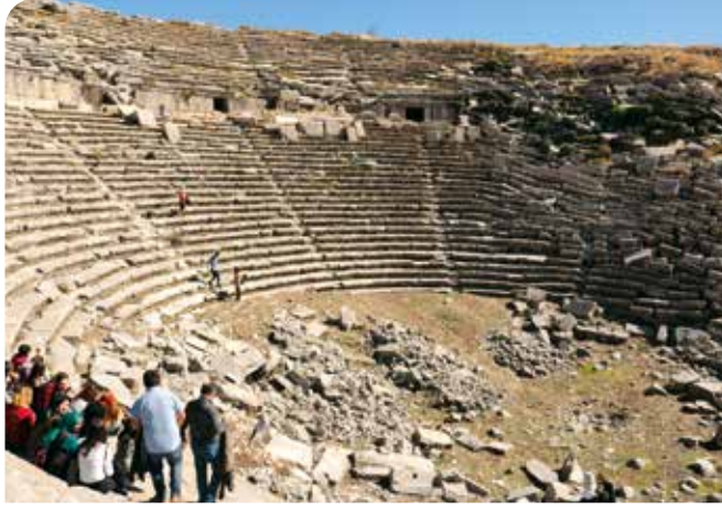
Bugün Sagalassos Tiyatrosu Anadolu'nun en etkileyici antik harabelerinden birisidir. İskender Tepesi sahne binasının tam arkasında kalır.