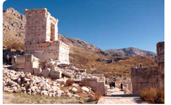
MS 400 civarında inşa edilmiş sur duvarları Dor Tapınağı ile Kuzeybatı Heroon'u bağlar.