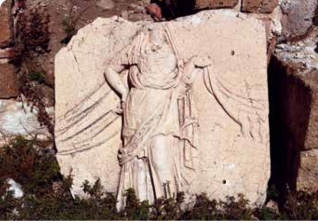
Kuzeybatı Heroon'un dans eden kızlar figürü