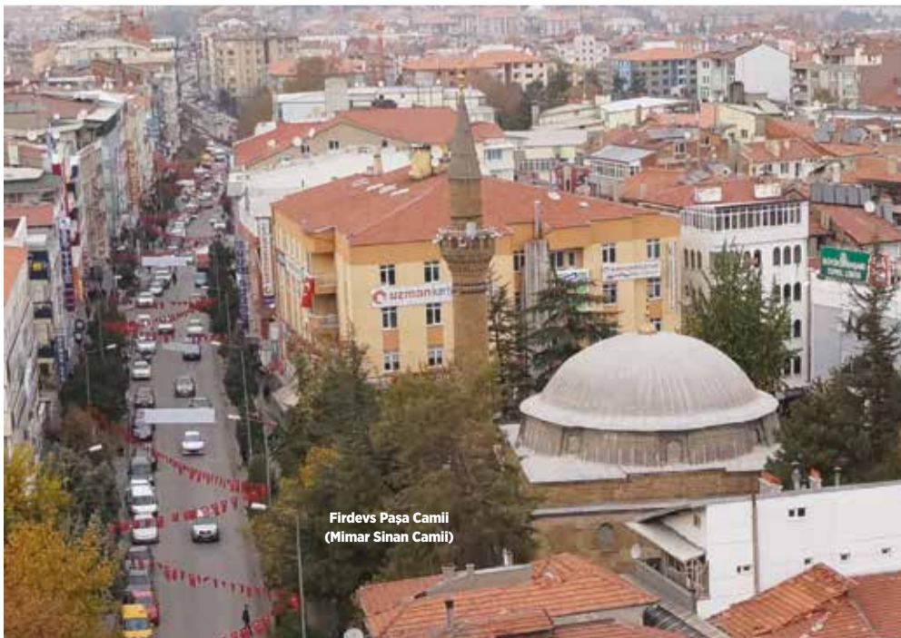
Firdevs Paşa Camii (Mimar Sinan Camii)

Mustafa Kemal Atatürk 6 Mart 1930'da Isparta'ya gelmeden önce Isparta'da şiddetli bir rüzgar esiyor bu rüzgarda Ulu Cami'nin tepesindeki hilal yerinden çıkıyor. Atatürk Isparta'ya geldiğinde konuşma yaparken bu durumu görüyor ve bu durum dikkatini çekiyor, ardından bizim dinimizin ve bayrağımızın simgesi yere düşemez diyerek kendi cebinden verdiği parayla caminin hilalini yaptırıyor.