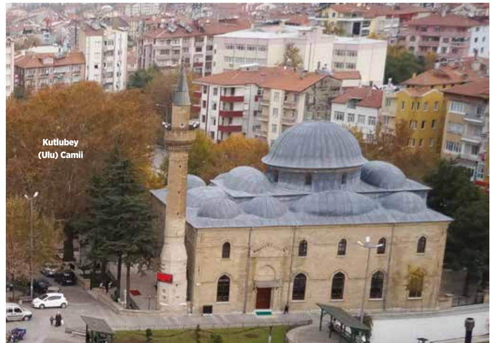
Kutlubey (Ulu) Camii