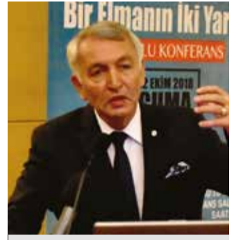
Yusuf Ziya Günaydın

var. Harf dediğimiz şey, moleküller. Bunlar; adenin, timin, guanin, sitozin. İşte bu 3 milyar harf içerisinde birbirimizden farkımız sadece 1000/1’dir. 3 milyar çiftin 1000/1’i 3 milyon yapar. Dolayısı ile 3 milyon farkımız var diyebiliriz. Bunlar burun yapımız, saçımız, parmağımız gibidir. İşte bunlara polimorfizm (çok biçimlilik) diyoruz.” dedi. 1990’ların başında başlayıp 2003’te biten “İnsan Genom Projesi”nin kendilerine hiç bilmedikleri bilgiler sunduğunu ve bu bilgilerle ileride çok önemli çalışmalara zemin hazırlayacağını sezdiğini belirtti. Savaş, o sırada Dünya Sağlık Teşkilatında, Avrupa Direktörü olarak görev yaptığını, bu bilgiler doğrultusunda da Türkiye’ye dönerek çalışmalara başladığını anlattı.